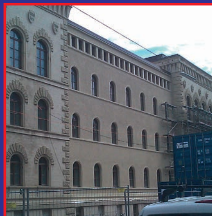
Zu den Prestigeobjekten des 130-jährigen Unternehmens zählt die Europagallerie, bei der der Außenputz an der ehemaligen Bergwerksdirektion von den Fachleuten erneuert wurde.