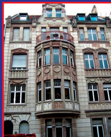
Für dieses Objekt in der Saarbrücker Lessingstraße wurde der Meisterbetrieb mit dem „Bundespreis für Handwerk in der Denkmalpflege im Saarland“ ausgezeichnet.