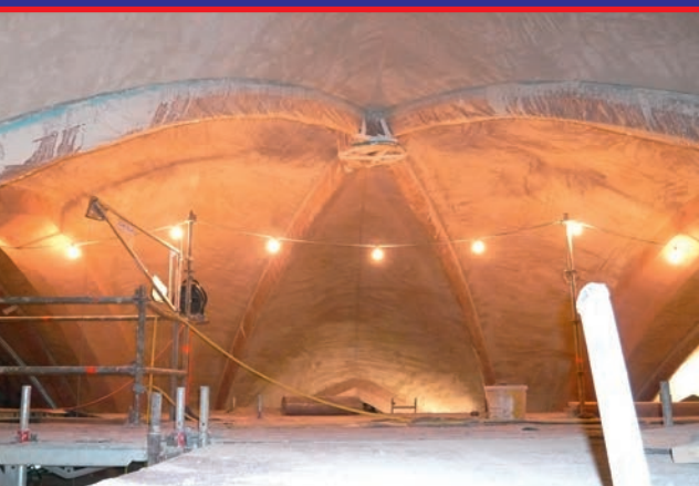
Auch sehr aufwendige Aufgaben, wie hier bei der Restaurierung der Josefskirche, meistert das Unternehmen.